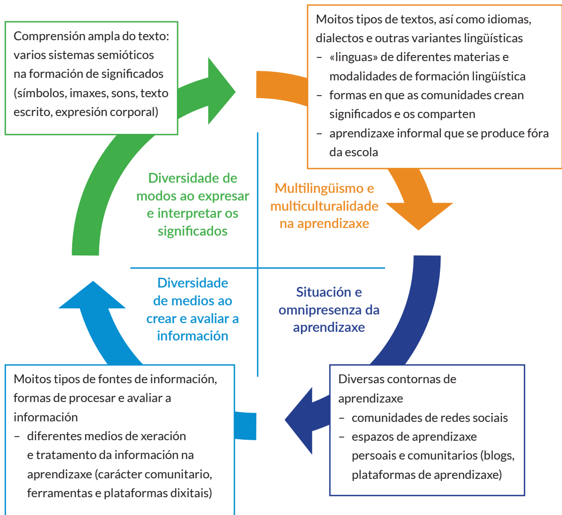
FIGURA 2. Multialfabetización na aprendizaxe e o estudo

Comprender e aplicar os fundamentos dos dereitos de autor, así como respectar os dereitos de autor, forman parte da multialfabetización e, ao tempo, tamén dos obxectivos e contidos dos novos plans de estudos en todos os niveis de ensino e materias. A ensinanza baseada na capacidade do aprendiz e a busca e creación independente de información favorece a produción creativa, que se traduce nunha ampla gama de producións: textos, obras de artes visuais, vídeos e obras multimedia (FIGURA 3). En relación coa produción creativa, utilízanse diferentes equipos e software, practícase o uso de medios dixitais e apréndense a utilizar e interpretar distintas fontes. Este tipo de traballo baseado en proxectos reflíctese en todas as materias e contidos de estudo. O uso responsable dos produtos e equipos, así como o recoñecemento dos dereitos de autor, son unha parte fundamental para aprender as habilidades de aprendizaxe de acordo cos novos plans de estudos.