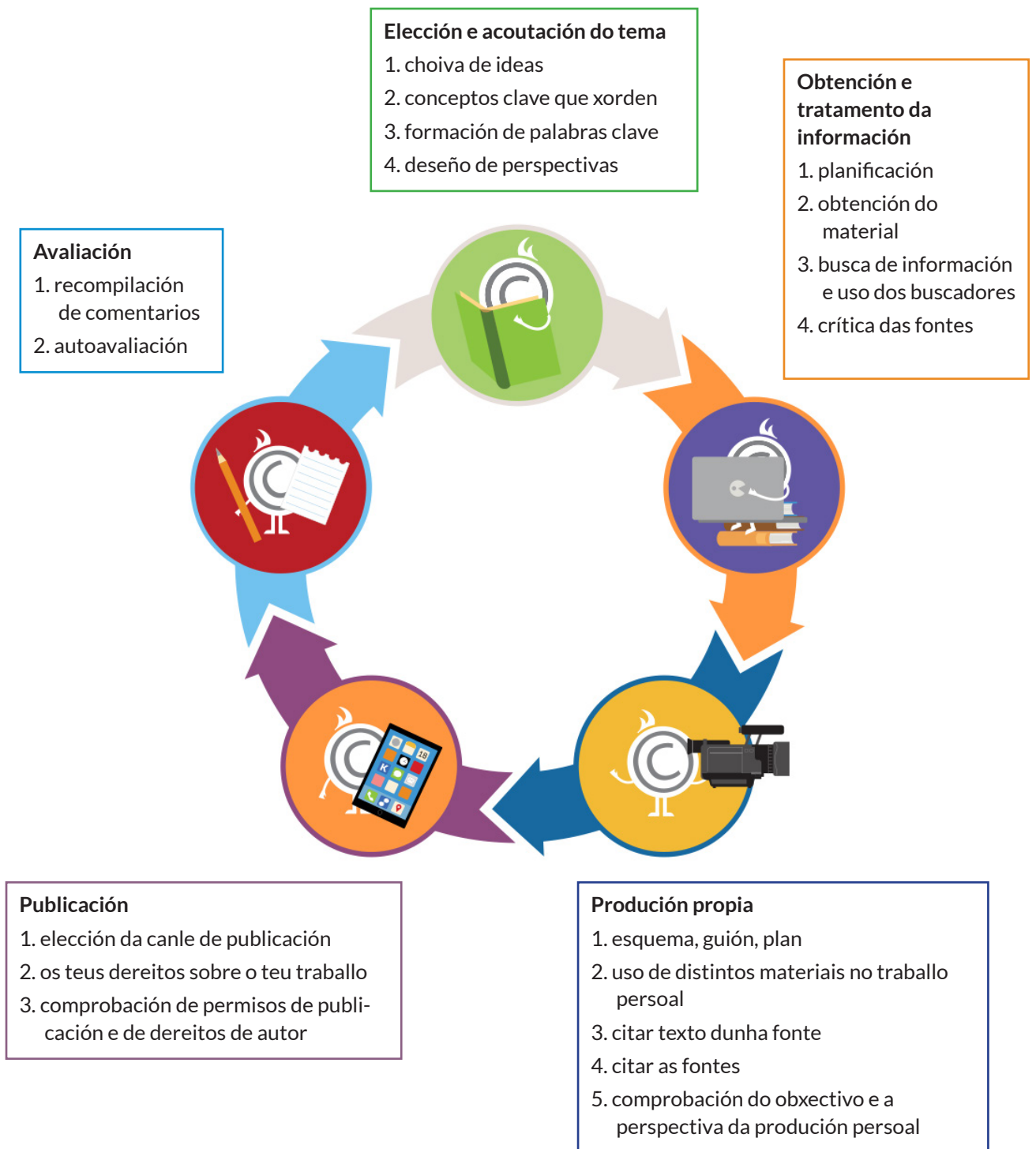
FIGURA 5. Percorrido para a produción persoal do estudante